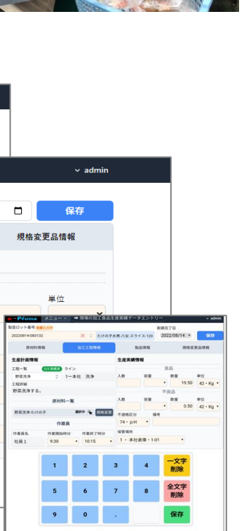
製造ロット番号 払い出し